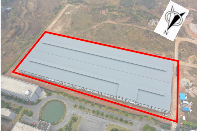
项目区现状（拍摄时间2024年11月）