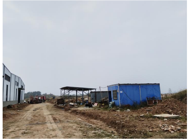
项目施工场地区现状（拍摄时间2024年11月）