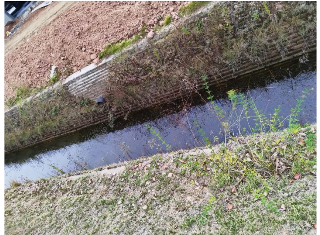
项目区北侧排水渠现状（拍摄时间2024年11月）