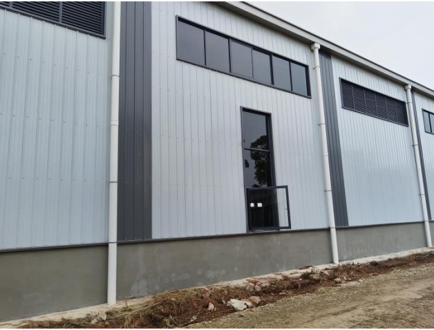
项目建筑物区现状（拍摄时间2024年11月）