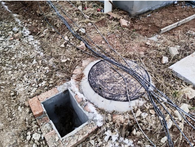
项目沉沙池和雨水井现状（拍摄时间2024年11月）