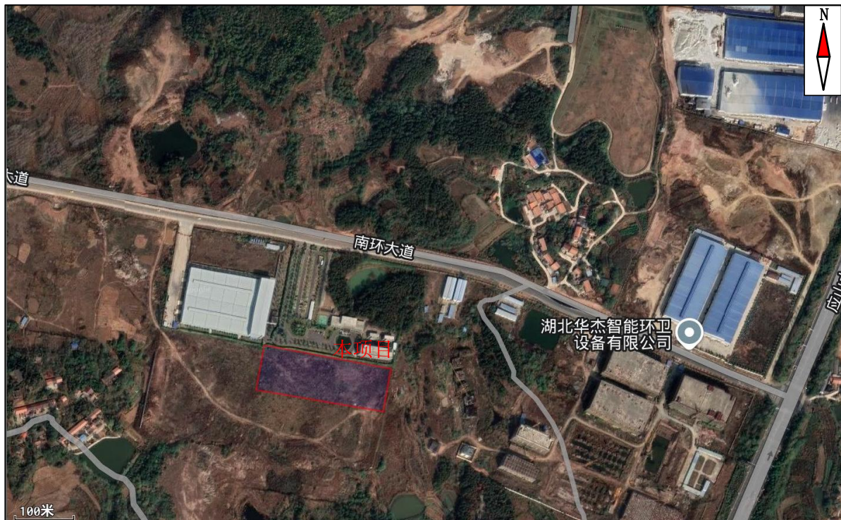
图2-1 项目施工前占地情况卫星图

备注：临时堆土场区、施工场地区、施工便道区位于主体工程建筑物内，不再重复计算占地。