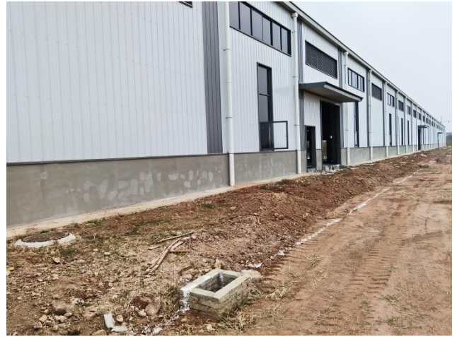
项目区建筑物区现状（拍摄时间2024年11月）